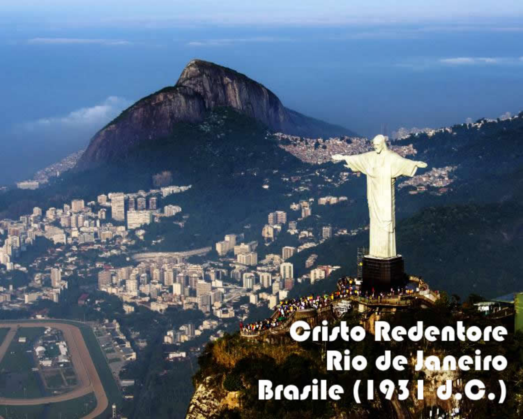
Cristo Redentore Rio de Janeiro Brasile (1931 d.C.)