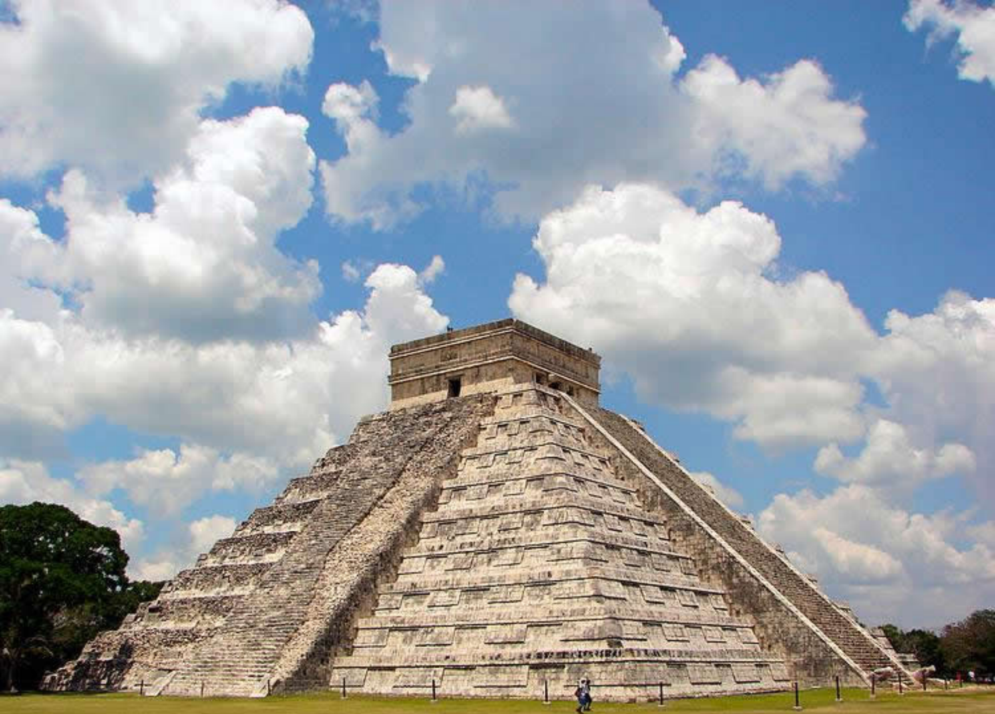
Chichén Itzá - Yucatàn - Mexico (60d.C.)